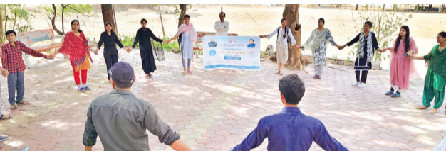
हरिभूमि न्यूज ॥ सारंगपुर

मध्य प्रदेश जन अभियान परिषद द्वारा संचालित वीएस डब्लू तथा एमएस डब्लू कक्षा के छात्र-छात्राओं ने ‘जल गंगा सर्वधन अभियान’ के तहत जागरूकता कार्यक्रम आयोजित किया। इस दौरान विद्यार्थियों ने मानव श्रृंखला बनाकर जल संरक्षण की शपथ ली। छात्र-छात्राओं ने संकल्प लिया कि वे अपने-अपने गांवों में जाकर लोगों को जल संग्रहण के प्रति जागरूक करेंगे, स्वयं भी जल बचाएंगे और दूसरों को भी इसके लिए प्रेरित करेंगे। इसके