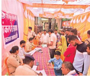
हरिभूमि न्यूज ॥ सारंगपुर