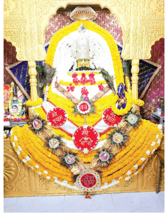
हरिभूमि न्यूज ॥ ब्यावरा

शहर के एबी रोड अरन्या पुल के पास बने श्री खाटू श्याम मंदिर में रविवार को कामदा एकादशी का पर्व श्रद्धापूर्वक